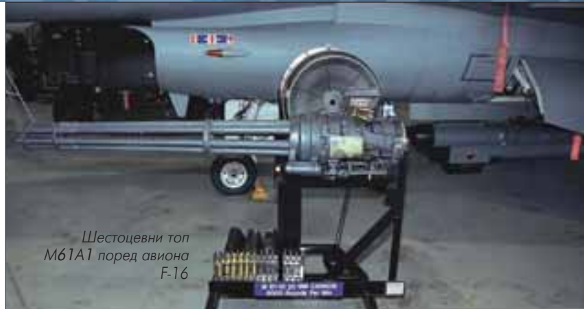
Шестоцевни топ M61A1 поред авиона F-16

Не треба заборавити да је ракете ваздух-ваздух немогуће користити и нерента-