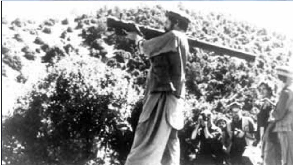
Муџахедини су на располагању имали и ограничен број ракета СА-7, кинеске производње

Извор из редова устаника наводи да је лично посматрао лансирање тринаест ракета Blowpipe током једне битке, од којих су све промашиле, и то сликовито описује речима: „Био је то лов на дивље патке у ком су патке победиле“.