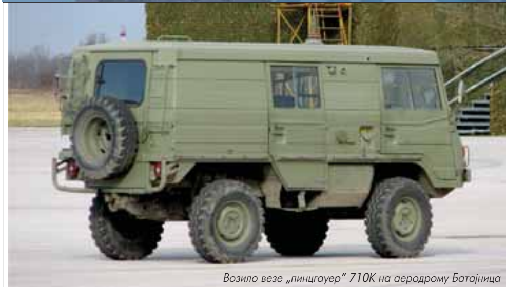
Возило везе „пинцгауер“ 710К на аеродрому Батајница

сту кабину. За санитарску службу израђене су две верзије: 710АМВ-У, са фиксном чврстом кабином, и 710АМВ-S, са кабином која се може скинути за независан превоз на другом возилу или ваздушним путем. Троосовинци су израђивани за превоз до 14 људи, до 1.500 кг терета и као покретне радионице и ватрогасна возила.