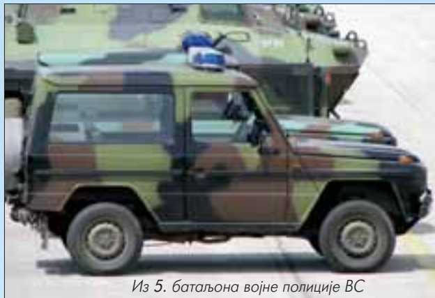
Из 5. батаљона војне полиције ВС

У Противтерористичком батаљону из Панчева налази се једно возило модификовано 2001. године намењено за прилаз објекту дејства. ■