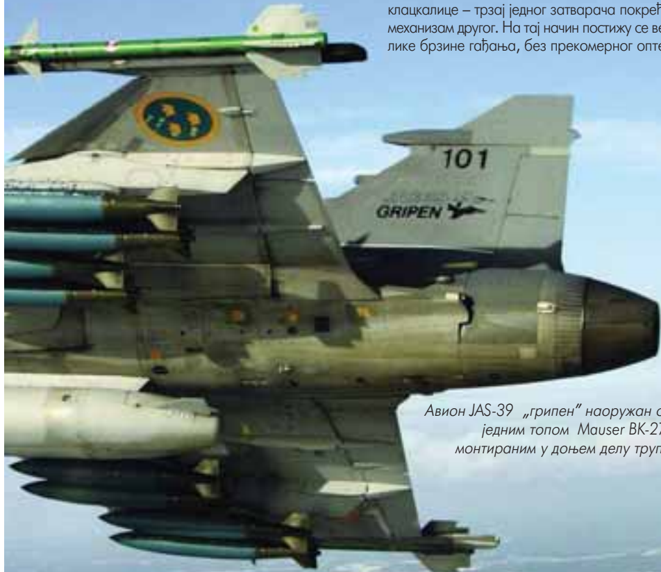
Авион JAS-39 „грипен“ наоружан са једним топом Mauser BK-27, монтираним у доњем делу трупа

Западне земље наставиле су да користе револверски принципа рада, а типични пример, и за сада комерцијално најуспешнији авионски топ, јесте немачки Mauser BK27, необичног калибра – 27 мм. Брзина гађања је 1.700 мет/мин, а муниција је, иако мањег калибра од 30 мм, по кинетичкој енергији готово равна руској од 30 милиме-