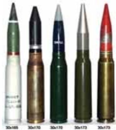
Муниција калибра 30 мм: руска, два типа швајцарске за топ Oerlikon KSA и две варијанте америчке за GAU-8/A

тара. Захваљујући лакшем пројектилу брзина зрна је већа него код ГШ-30-1. Топ се користи на авионима Tornado, Typhoon II, Alphajet и JAS-39 Gripen.