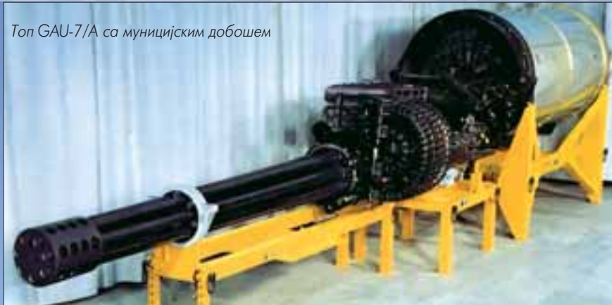
Топ GAU-7/A са муницијским добошем

4.000), али и знатно мању масу топа (што је иницијално стварало бројне проблеме на авионима МиГ-27).