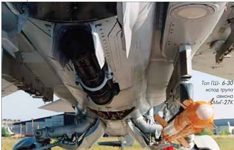
Топ ГШ- 6-30 испод трупа авиона МиГ-27К