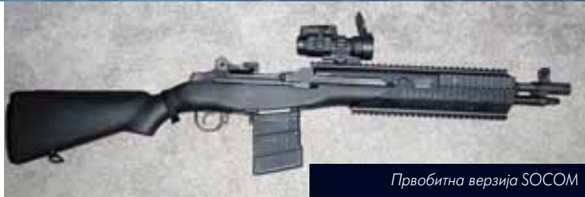
Првобитна верзија SOCOM

Уз мноштво понуђене оптике која се може монтирати на SOCOM II издваја се оптички нишан Talon који има могућност увећања од 1 до 4 пута, иначе производ