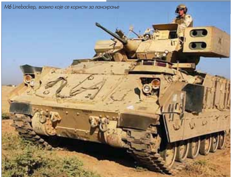
M6 Linebacker, возило које се користи за лансирање

У близини америчке војне базе у Саудијској Арабији пре неколико година пронађена је ПА ракета SA-7 са лансером. Истрага је утврдила покушај лансирања, али и неуспех због грешке руковоаца. Ухапшен је један Суданац, за кога се сматра да је могао бити повезан са Ал каидом.